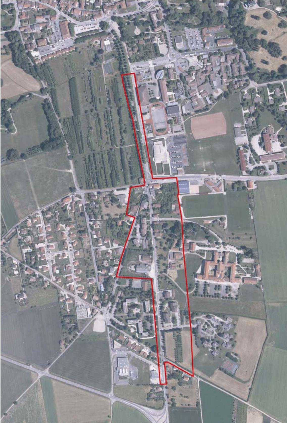
Périmètre de l'OAP n°3