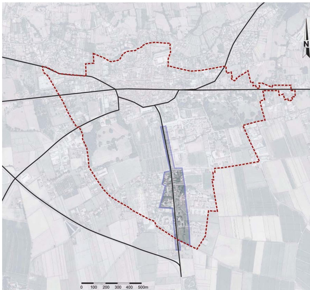
Situation de l'OAP de l'avenue Hector Berlioz dans l'EPD